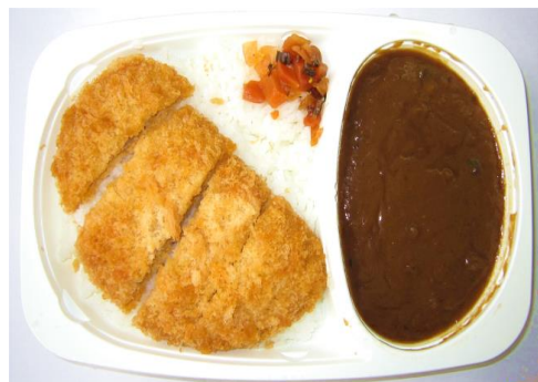
カツカレー 520円 カレーライス 450円 カレーライス大盛500円