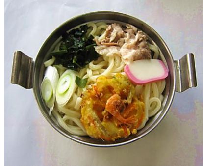
鍋焼きうどん 530円 (冬季のみ)